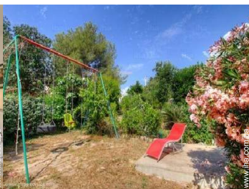
Instalaciones de ocio