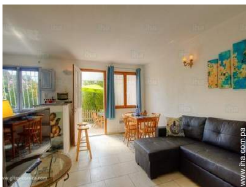
sala de televisión