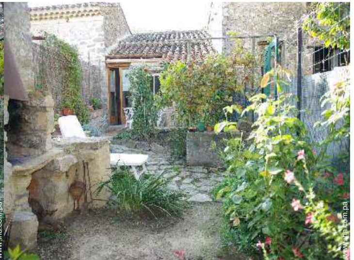
Instalación exterior a disposición de los huéspedes