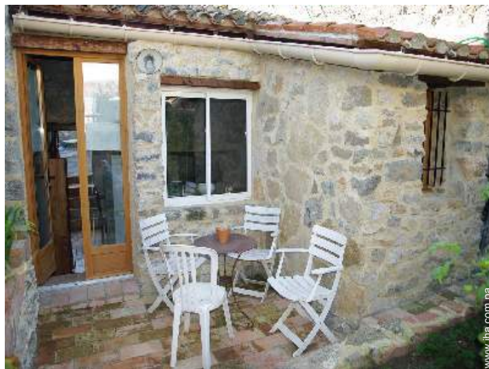
Marco exterior a disposición de los huéspedes