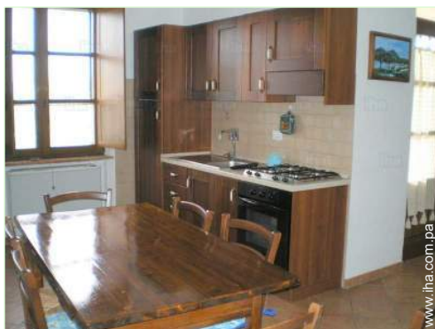
área de cocina