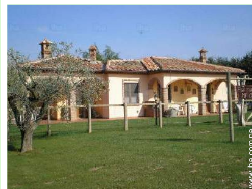
vista desde la casa