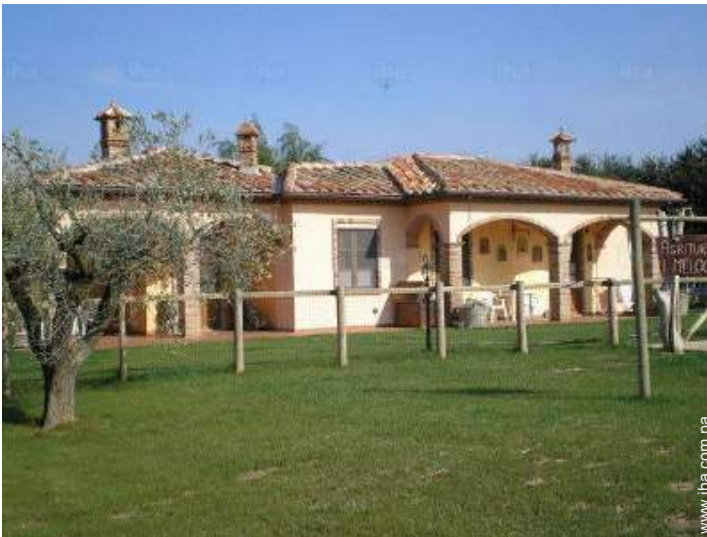
vista desde la casa