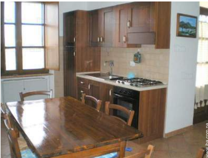
área de cocina