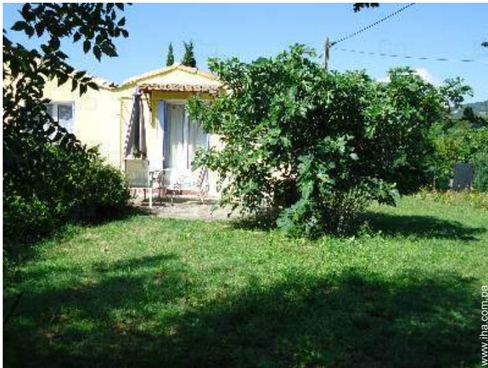
Marco exterior a disposición de los huéspedes