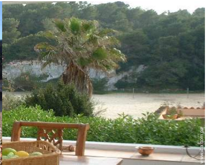
vista desde la veranda