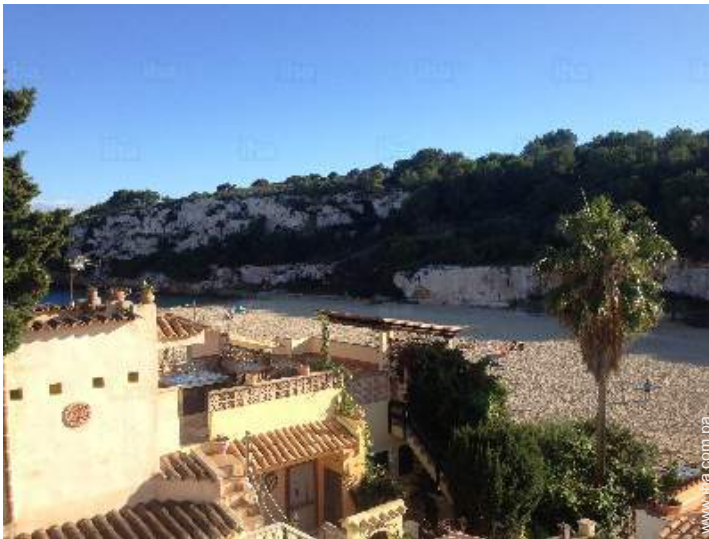
vista desde la azotea