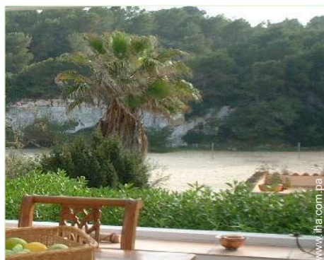
vista desde la veranda