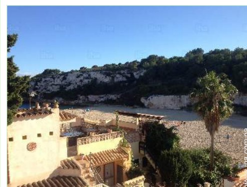
vista desde la azotea

Mar/océano <50m Playa de arena <50m Pista de tenis pública 1km Recorrido de golf 9 hoyos 15km Recorrido de golf 18 hoyos 15km Base aeronáutica 50km Anuncio de windsurf 15km Base náutica 25km Puerto deportivo 5km