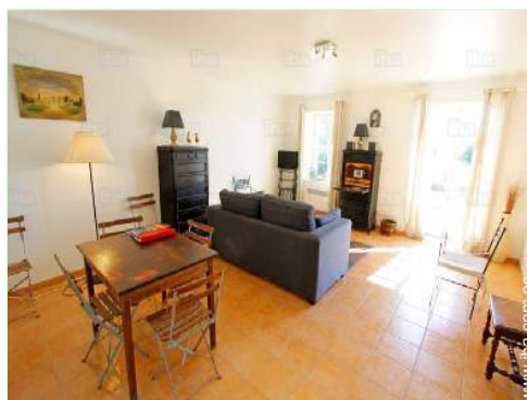
sala de televisión