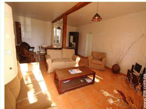
sala de televisión

Mar/océano 50km Playa de arena 50km Piscina pública 5km Pista de tenis pública 5km Recorrido de golf 18 hoyos 10km Lago 10km Cadena montañosa 50km