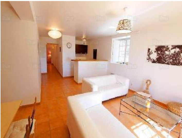
sala de televisión