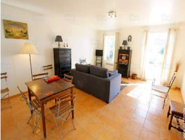
sala de televisión