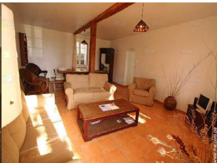
sala de televisión