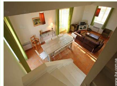
sala de televisión