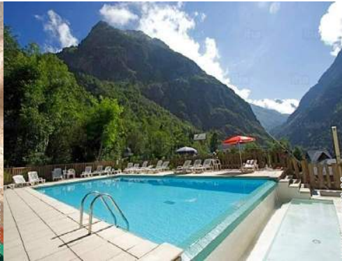
piscina en la residencia