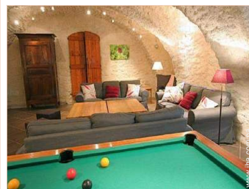
Instalaciones a disposición

Centro del pueblo Parada/estación de guagua