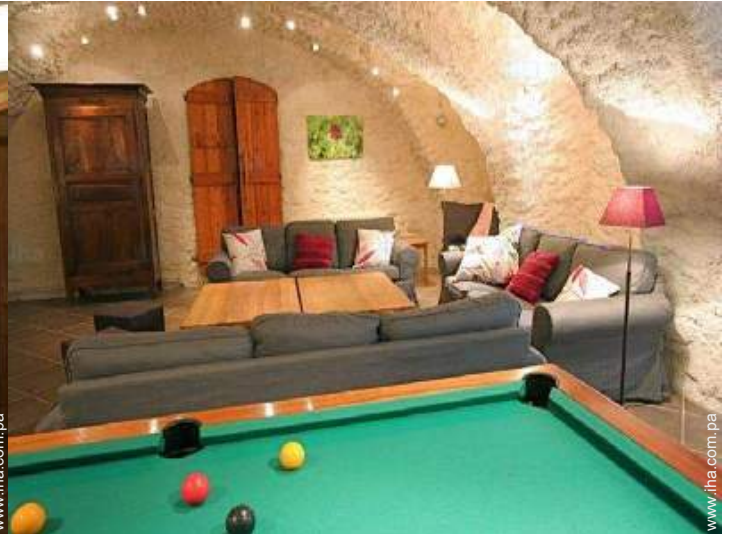
Instalaciones a disposición