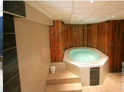
Instalaciones a disposición