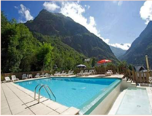
piscina en la residencia