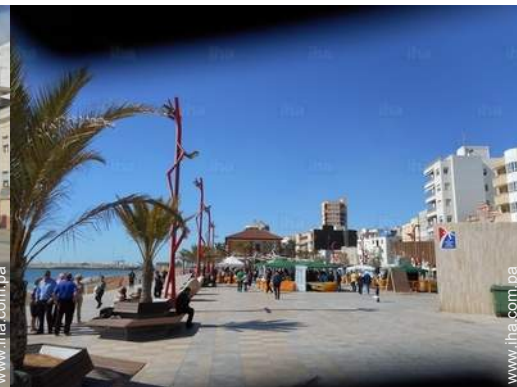
Zonas atractivas y relajación