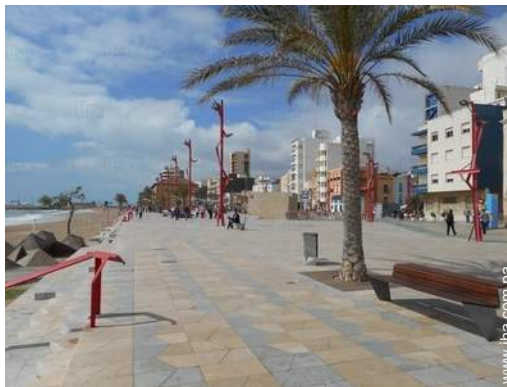
Zonas atractivas y relajación