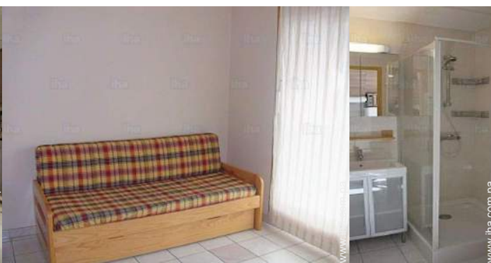
sofá cama 2 pers