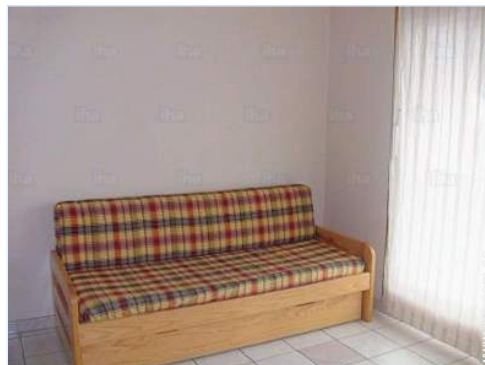
sofá cama 2 pers