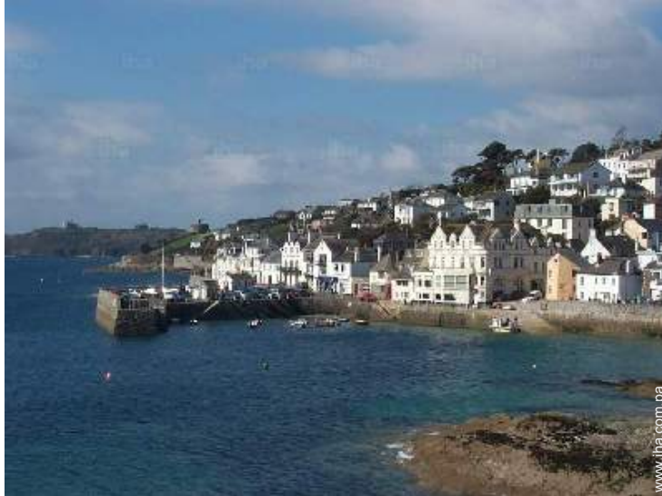
centro del pueblo