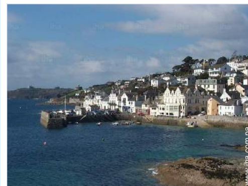
centro del pueblo

Centro del pueblo Alquiler de barco Panadería Pequeños comercios Correos Banco Farmacia