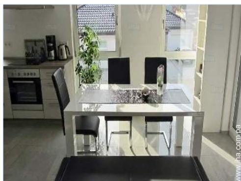
vista desde le comedor