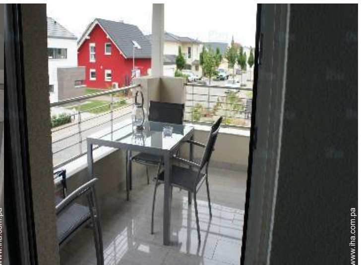
vista desde el jardin/parque