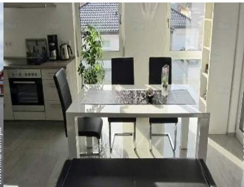
vista desde le comedor