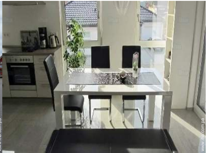
vista desde le comedor