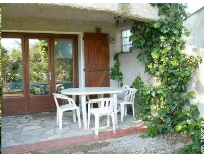
vista sobre el patio