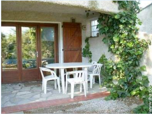
vista sobre el patio