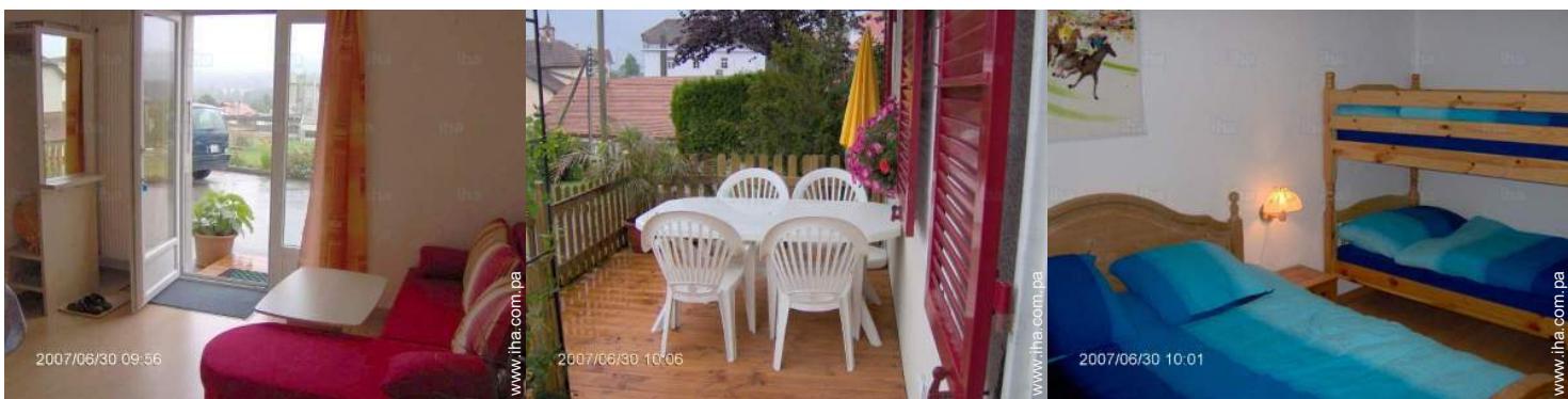
vista desde el cuarto de estar