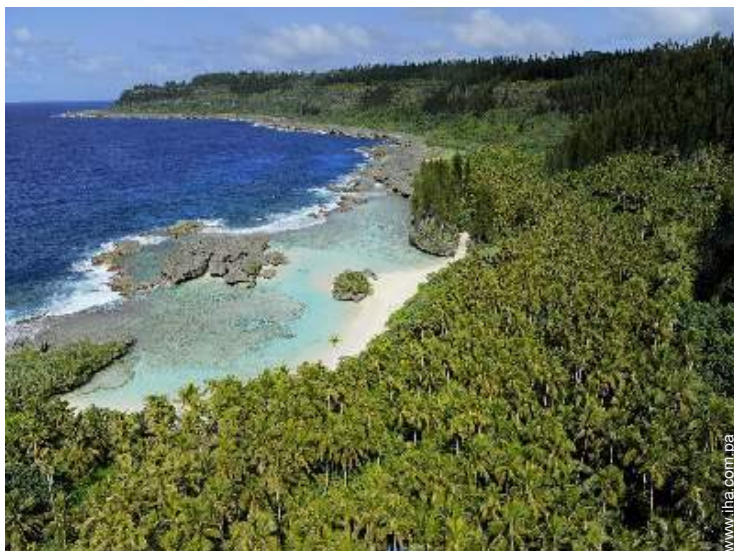
playa de arena