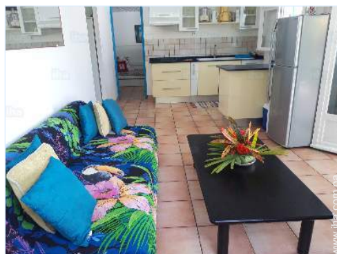
vista desde el salón