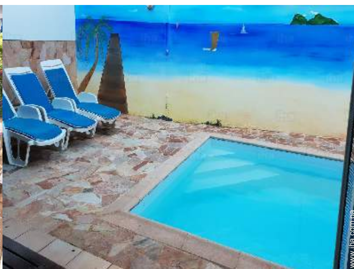
vista desde la terraza cubierta