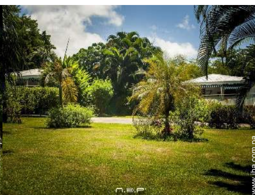
vista desde el jardin/parque