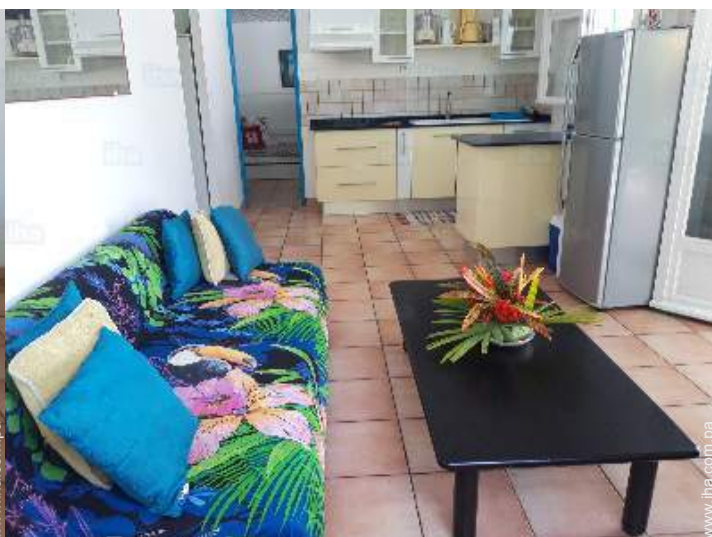
vista desde el salón