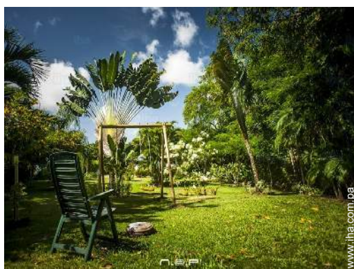
instalación de ocios