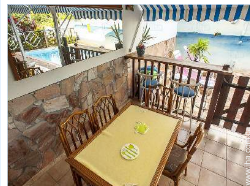
vista desde el dormitorio