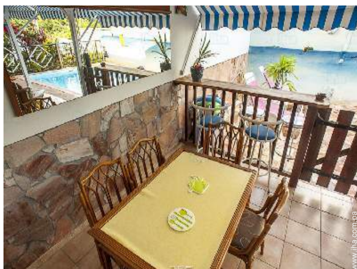
vista desde el dormitorio