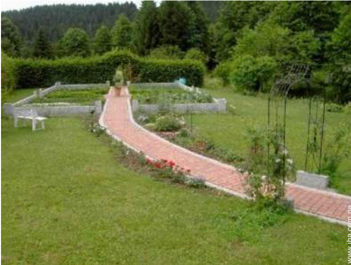
vista sobre el jardin/parque