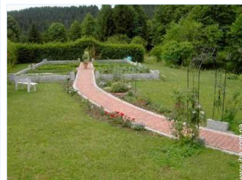
vista sobre el jardín/parque