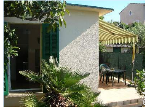
vista de conjunto