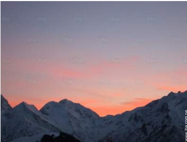
vista desde el apartamento