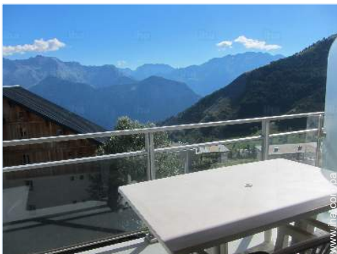
vista desde el apartamento