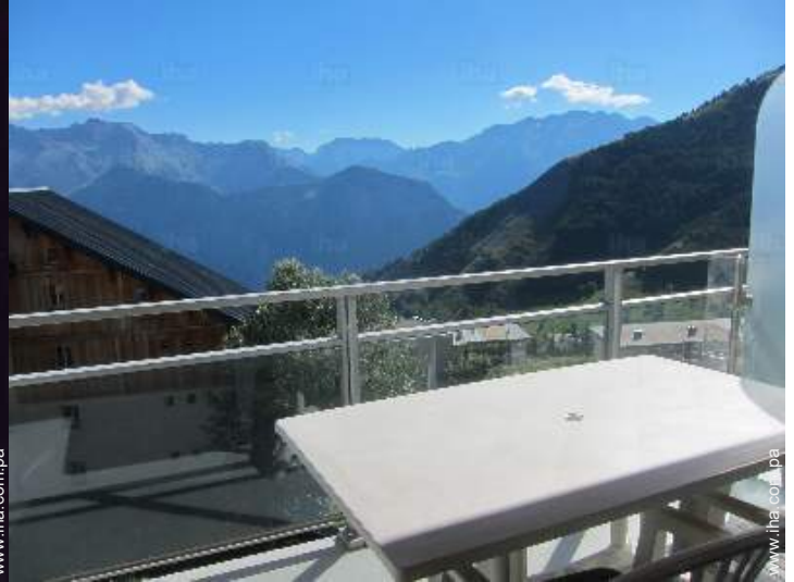
vista desde el apartamento