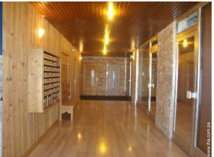
local de esquí