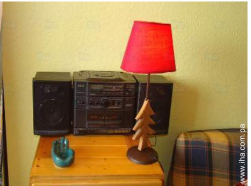
cadena de música