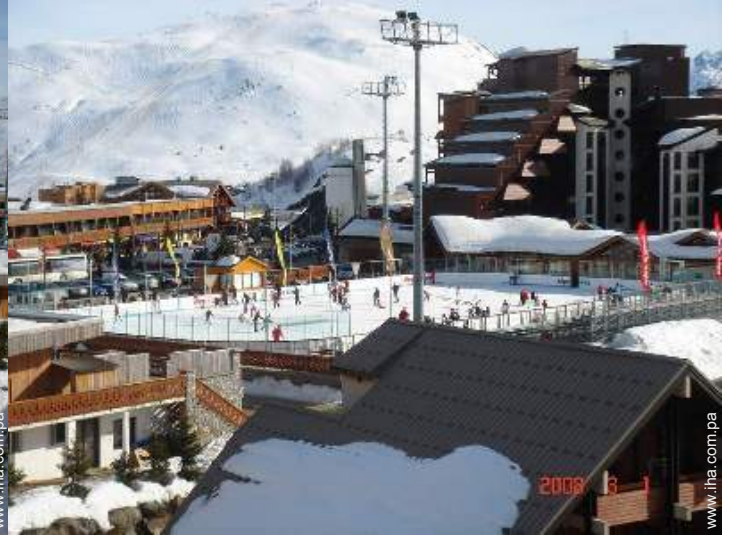
pista de patinaje