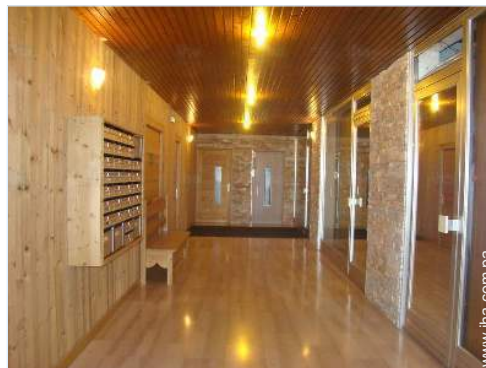
local de esquí