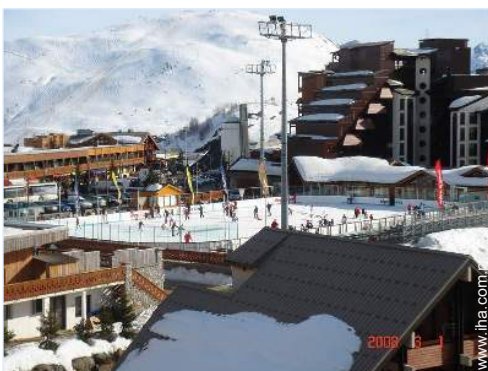
pista de patinaje