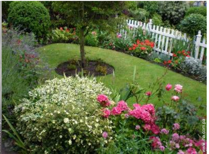
vista sobre el jardín/parque