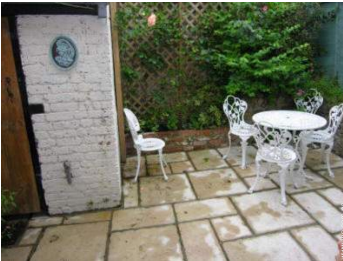
vista sobre el patio